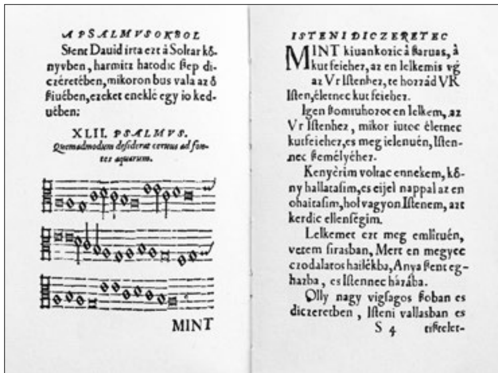
XLII. psalmus. „Mint kívánkozik a szarvas a kút fejehez”

A már elkészült első fordításokat a június 16-án, a gyülekezet karitatív és kulturális központjában a Németh Géza Emlékkonferencián mutatták be a jelenlévő költők, a délután az új hangon megszólaló zsoltároké és megszólaltató költőké volt. Ezekből nyújtunk egy csokornyit a lapszám olvasóinak kiegészítve a programban részt vevő költők egy-egy személyesebb zsoltárával vagy kortárs költők hasonló szövegével.