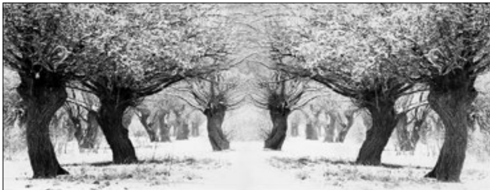
A FÁK TÁNCA

Reméli, hogy a taxi épségben felfuvarozta őket a szállodába. Eszébe se jut, hogy egy szóval sem említették, mikor jönnek legközelebb.