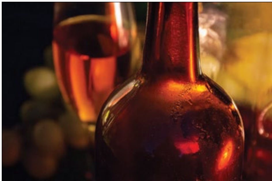
CSENDÉLET EGY ÜVEG BORRAL