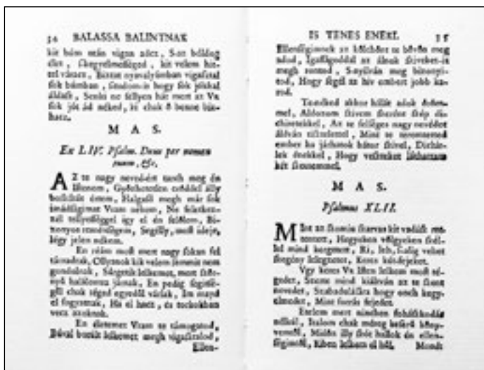
Balassi Bálint: Psalmus LIV. és XLII. = Gyarmati Balassa Bálintnak Istenes éneki , Bécs, 1633.