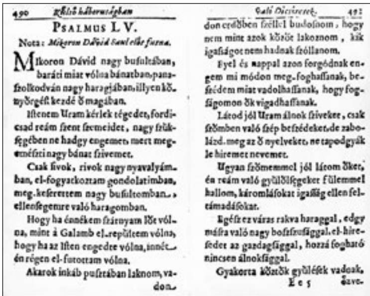
Kecskeméti Végh Mihály: Psalmus LV. „Mikron Dávid nagy búsuftában” = Keresztyéni isteni dicsíretek, Lőcsé, 1642, 490-491.

talán ez a rend bolygók keringünk felváltva tépjük a tereket körénk tekerednek széthasad amit csak megkülönböztetek hogy legyél legyek nem vagyok gyáva csak szellemileg egy lenni veled bár félek nem hogy veszek de hogy elveszítlek egyre több mást ragyogó rebbenésed mint rúgott kavicsot képzeletem mélyére görgöt a mindenség már oda született az űr köztünk egyre nehezebb