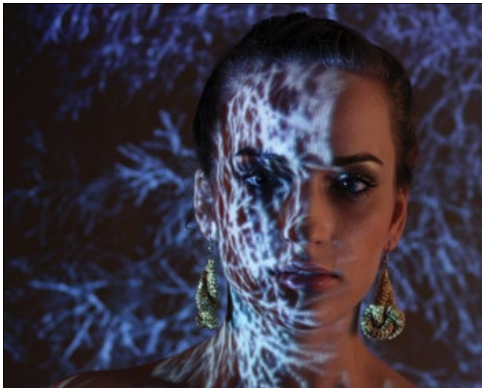
GYÖNYÖRŰ SZEMŰ NŐ