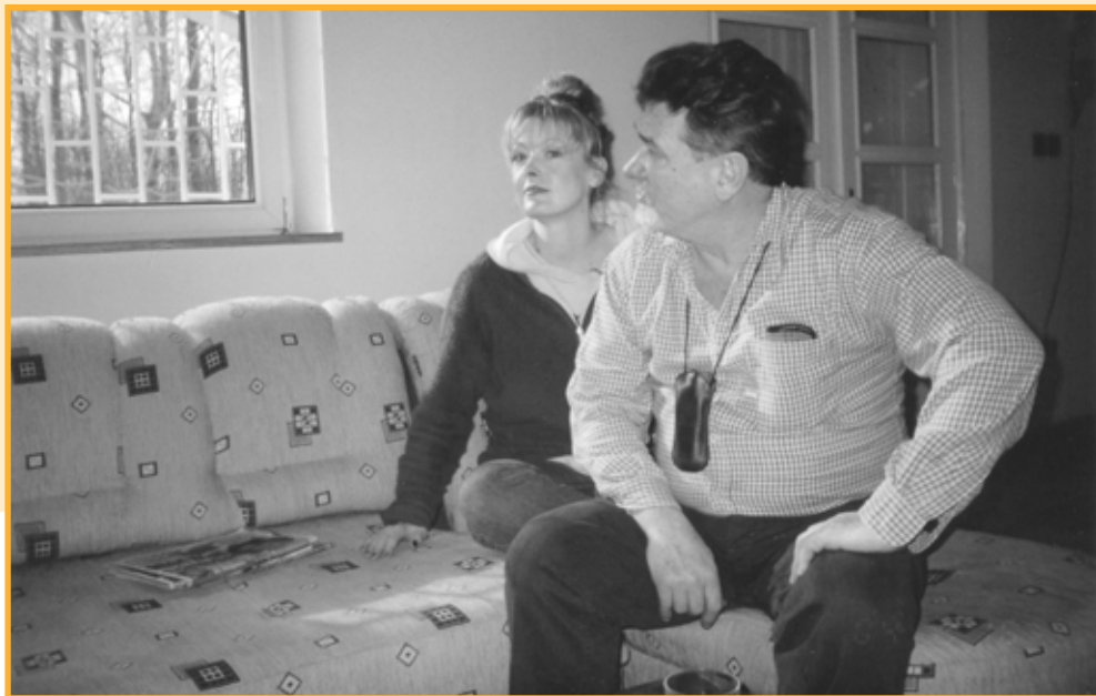
A SZERZŐ ÉS LEÁNYA FOTÓJÁT KONCZEKNÉ ERIKA KÉSZÍTETTE

Ezeket a verseket negyven év írásaiból választottam. A tájjal maradtam című előző kötetem verseinek „holdudvara” ez az összeállítás. A tájjal, a hozzám közel állókkal maradtam most is – az „ölelhető térben, térségben”, ebben a medencében, hazánkban. K. J.