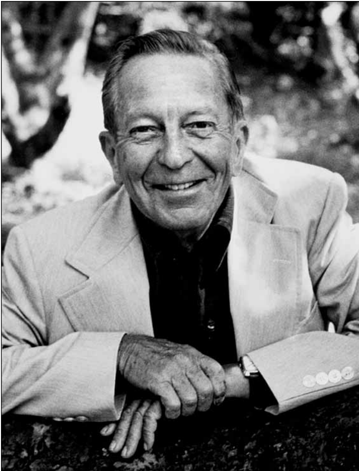
PHILIP LARKIN (1922–1985)