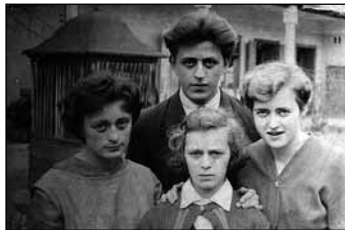
A négy testvér 1953 tavaszán, Pásztón