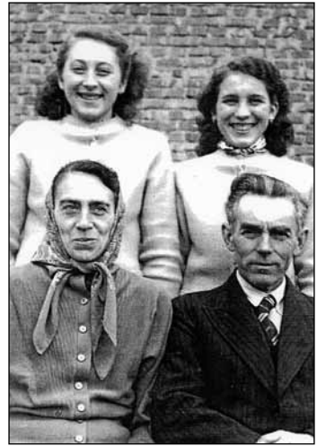
Nővéremmel és szüleimmel 1955-ben

A 7. osztálytól a járási központba, Marcaliba jártam iskolába. Ez a váltás azért volt fontos, mert falunkban nem tanítottak oroszul. Legalább a legalapvetőbb ismeretekre szükség volt a továbbtanuláshoz. Akkoriban nem volt helyközi tömegközlekedés vidéken, így minden reggel, ha esett, ha fújt, 11 kilométert bicikliztünk az iskolába, és délután ugyanennyit vissza. Hatan jártunk be, én voltam a legfiatalabb. Jól szórakoztunk útközben. Az általános iskola végén, nyolcadikban felmerült a kérdés, hogyan tovább. Mivel éppen akkor indult Marcaliban gimnázium, kézenfekvő volt, hogy ott tanuljak tovább. Az első évben nem igazán tetszett, de sajnos nem volt más választásom, és ki kellett tartanom. Minél tovább tartott, annál nehezebbre esett. 1958-ban mindennek ellenére szerencsésen leérettségiztem. Ebben az időben született egy barátság, amely mindmáig megmaradt. Rendszeresen tudatjuk egymással, hogy vagyunk, melyikünket milyen bánat és öröm ért. Gimnáziumi éveim alatt sok izgalmas dolog történt. A folyamatos elnyomás, amelyet állandóan éreztettek velünk, nagy súllyal nehezedett mindannyiunkra. Voltak tanárok, akik ezt rajtunk vezették le. Gyakran cserélődtek a tanárok, ami nem éppen segítette a