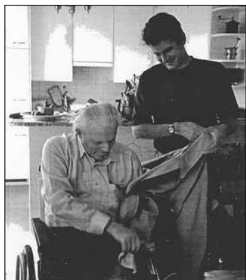
Férfjem és fiam 2005-ben