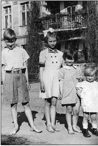
1948-ban már négyen voltunk testvérek, és városban laktunk