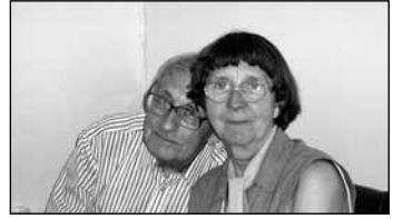
Negyven évvel később