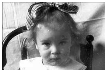
1941-ben; feltehetően a Karmelicka utcai fényképész felvétele

Egy évre rá a tiszteletre méltó doktor úr holttestét már a katyáni erdő földje borította. A születésem napját követő napon írták alá ugyanis gyilkos szövetségüket a berlini Übermenschenek és a moszkvai elvtársak.