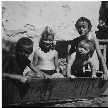
Fürdik a négy testvér a fakádban az udvaron, 1948 nyarán, Szirákon

Jól ismerte a gazdák tevékenységét, a nagygazdákét is, akik később a kulákok lettek. Azok a lehető legjobban teljesítettek mindent, hogy ne lehessen a munkájukban hibát találni. Nem lehetett róluk rosszat jelenteni. Kezdtett gyanús lenni, hogy édesapámtól nem érkezik be egy kulákfeljelentés sem. Mi lehet az oka? Lehet, hogy ő is kulák? – kezdtek ezen gondolkodni.