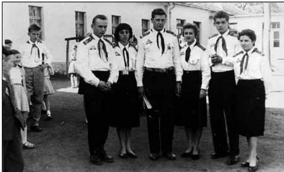
A bujái tantestület úttörővezetői (a középső lány vagyok) 1960-ban