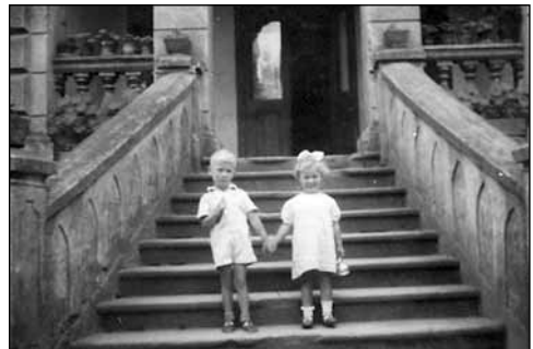
1942-ben bátyámmal Górkában

Falun viszonylag békében telt az életünk, legalábbis a mi gyermeki szemünkkel nézve. Időnként ugyan megjelentek marcona egyenruhások magas