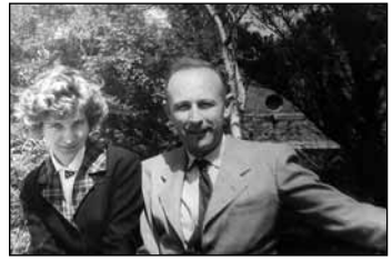
Férjemmel eljegyzésünkkor 1964-ben Budapesten

Rövidesen Budapestre költöztem. Azóta Magyarország lett a második hazám. Két fiunk (és most fokozatosan felnövekvő unokáink is) megismerkedtek lengyel családjuk és hazánk történetével, ezeket a sorokat nekik is írom... „Non omnis moriar.”