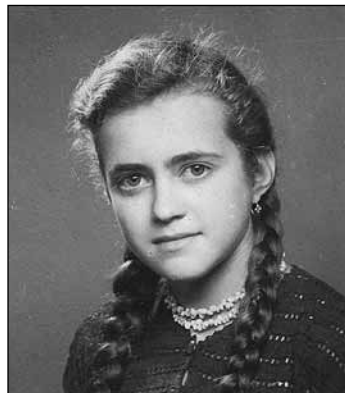
Ilyen voltam 14 évesen

A forradalom miatti tanítási (a téli és szén-) szünetekben mindig dolgoztam. Legtöbbször Pásztón, a kórházban, helyettes ápolónőként a csecsemő és a női belosztályon. Emlékezetes ma-