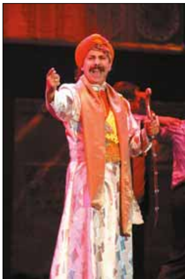
RAMA (SIR VARGA GUSZTÁV): ÁRULÁS-JELENET