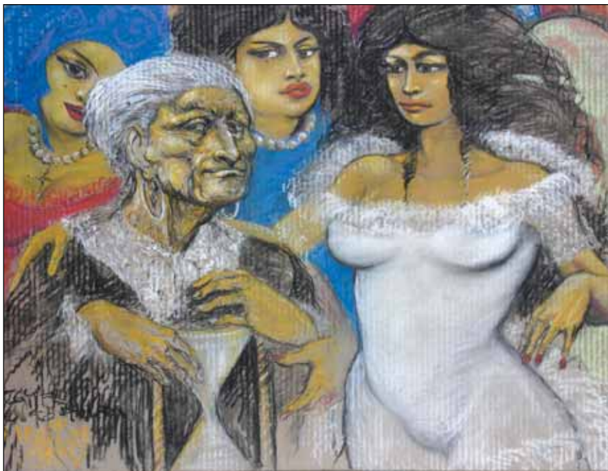
BALLADA A PÁRIZSI NŐKRŐL (VILLON-SOROZAT)