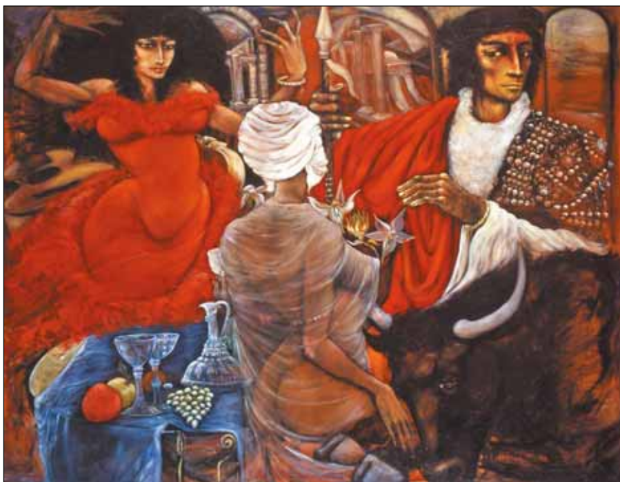
DUENDE (LORCA-SOROZAT II.)