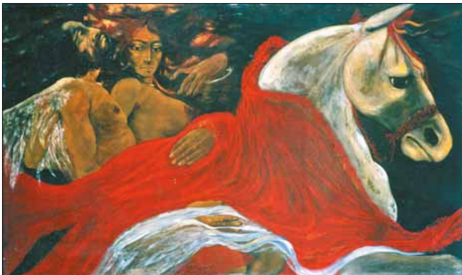
A HŰTLEN MENYECSCKE (LORCA-SOROZAT I.)