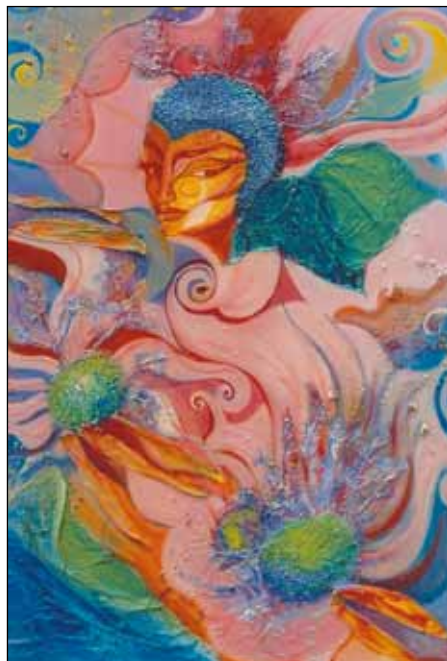
ILLÉS BÓDHI BARBARA TŰZVIRÁGOK I-II.