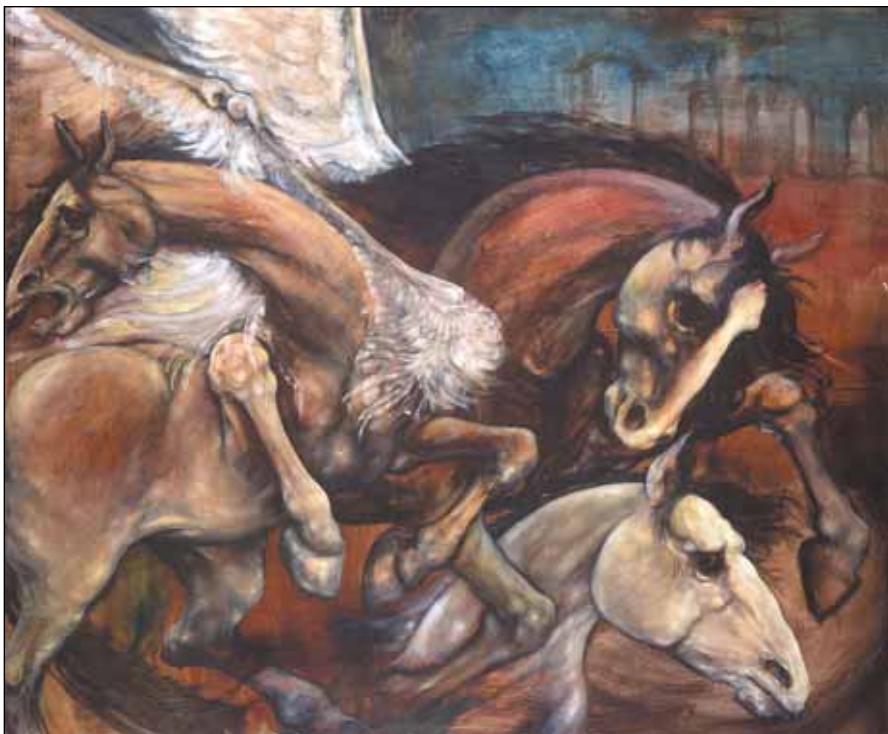
ÁGASKODÓ LOVAK (LORCA-SOROZAT II.)