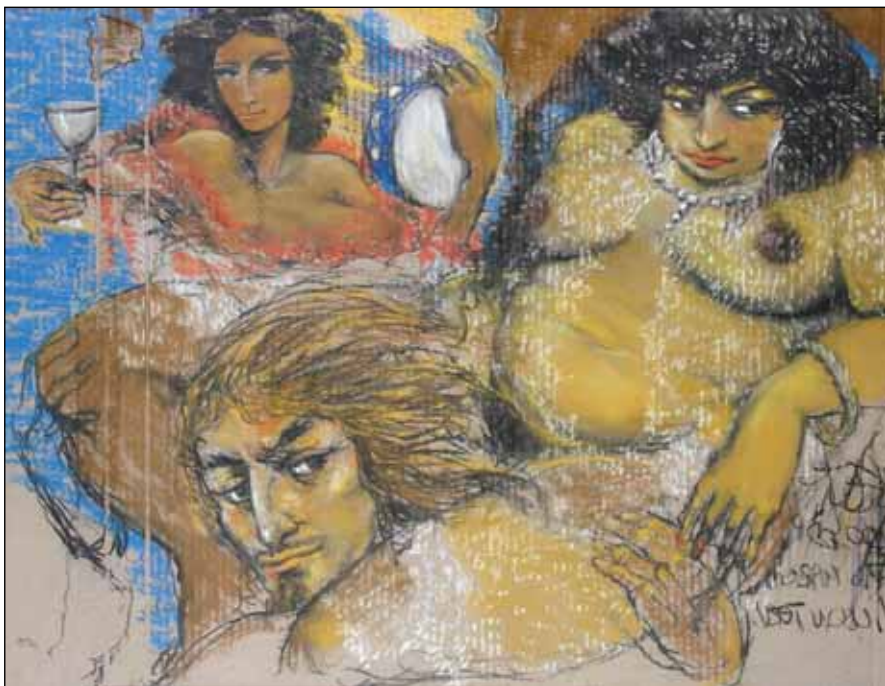
BALLADA VASTAG MARGÓRÓL (VILLON-SOROZAT)