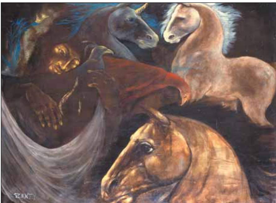
MEMENTÓ (LORCA-SOROZAT I.)