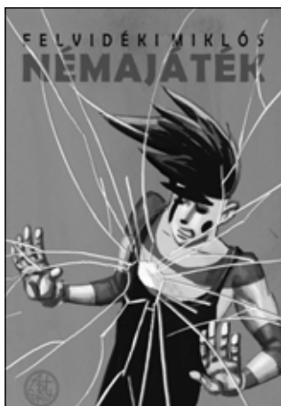
Felvidéki Miklós: Némajáték , Nyitott Könyvműhely, Buda- pest, 2011

Az alapgondolat, hogy egy képregény hőseül a nyelvi kommunikációt szinte nem is használó pantomimest válasszunk, kihívásokban bővelkedő kalandokat és izgalmas cselekményvezetést ígér. Felvidéki Miklós Némajáték című 2011-es képregénye a fura frizurájú, fehér arcú, első blikkre befelé forduló pantomimest helyezi a középpontba, akinek játéka vészhelyzetben valósággá válik. Az ötlet rengeteg lehetőséget rejt magában, hiszen a némajáték megjelenítése, majd a hősünk „rendkívüli képességéből” adódó bonyodalmak számos olyan – mind képtechnikai, mind elbeszélői – helyzetet sejtetnek, melyek rajzoló és olvasó számára egyaránt ígéretesnek tűnnek.