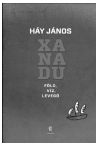
Háý János: Xanadu. Föld, víz, levegő , Európa Könyvkiadó, Budapest, 2013

Ahogy a címe is jelöli, a mű színterei a föld, a víz és a levegő. A földi színtér Velence és Piránó, benne két nővel, Velencei feleségével és Annával. A víz maga az utazás, a matrózok és Márió, a kapitány. A hajózásnak van egy másodlagos, könnyen hozzáférhető jelentése is: az élet mint utazás megszokott irodalmi toposza. A levegő pedig az égi palota, benne