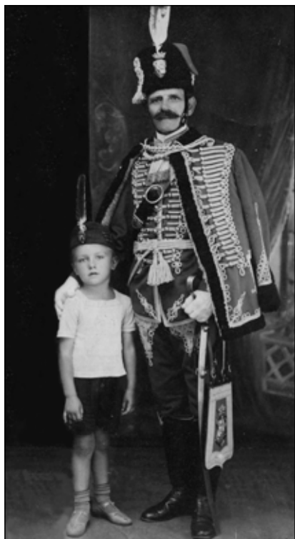
Nagypapa az unokájával

kás lett belőle... Esténként az alkohol, hétvégeken a lóverseny tartotta benne a lelket. Esténként olykor halkán énekelgette a kedvenc nótáit, amelyekkel nemrégén még az Alföld Szállóban mulatott cigányzenekari kísérettel. Anyja viszont rövidesen egy nőruha-gyár varrodájának lett a vezetője.