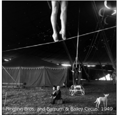
Ringling Bros. and Barnum & Bailey Circus. 1949

erőszak ez is – a táj vonalba szabott nemi szőrzete