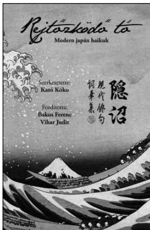
Rejtőzködő tó , Napkút, Budapest, 2015

Ezeket az évszakokat a természetben figyeli meg a költő, de az évszakban ábrázolt táj mögött mindig szimbolikus jelentés húzódik. A szimbolika eredete egyrészt maga a nyelv, másrészt a japán világkép, amelynek középpontjában az idő, ill. az időtlen-